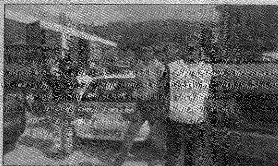
Le squadre impegnate nelle ricerche a Incoronata

Dopo una notte di angoscia, hanno potuto tirare un sospiro di sollievo i familiari di un 69enne di Macchiagodena, di cui si erano perse le tracce martedì sera. Fortunatamente ieri mattina il pensionato è stato ritrovato in stato di choc, ma tutto sommato in buone condizioni di salute, nelle vicinanze del cimitero del paese. In linea d'aria a non molta distanza dalla sua abitazione. L'uomo aveva passato la notte all'addiaccio. Sulle cause dell'allontanamento sono in corso accertamenti da parte dei Carabinieri. L'allarme è scattato all'ora di cena. L'uomo era atteso da i familiari, ma nella sua abitazione, posta nella frazione Incoronata, non si è presentato. I parenti lo hanno cercato in zona, hanno